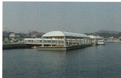
10号浮棧橋(南東方向から望む)

●宇野港内に入りましたら、ご一報ください。 TEL0863-31-3211(平日8:30~17:00) 上記以外の時間帯は以下の携帯をお願いします。 090-8995-3316 又は 090-9067-9273