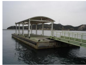
係留箇所 陸に向か って右側