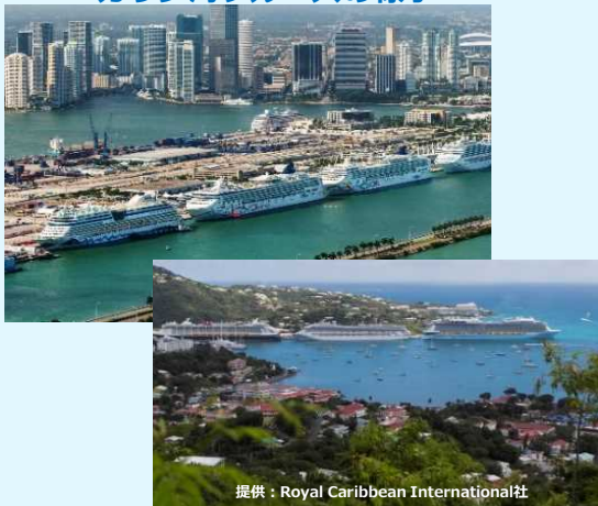
カリブ海クルーズの様子