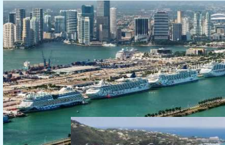
カリブ海クルーズの様子